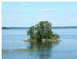
Hamn och Farled