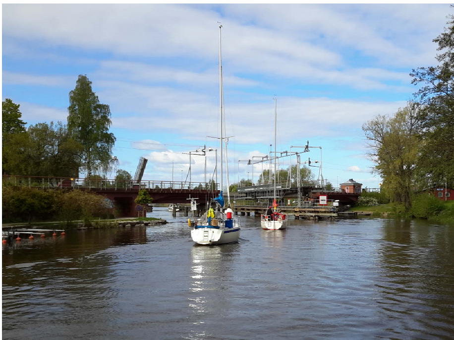
2015 års eskader passerar broarna i Kungsör och går in på Arbogaån.